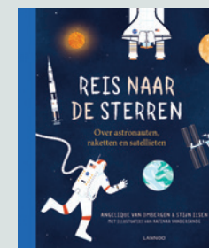
Uit het boek van Angélique van Ombergen en Stijn Ilse lannoo.be

Oplossingen 1. Juist: Door de gewichtloosheid zou alles rondzweven, ook hun armen en benen. 2. Fout: De maan is de allergrootste én oudste satelliet van de aarde. 3. Juist: Er werden ongeveer 5000 satellieten in de ruimte gebracht, waarvan meer dan de helft is stuk gegaan. Toch zweven ze nog steeds rond in de ruimte. 4. Fout: Ze proeven net minder, want in gewichtloosheid stijgt warme lucht niet omhoog en het eten dat in hun mond zweeft, heeft minder contact met de smaakpapillen op de tong. Daarom tact ze hun eten extra kruiden.