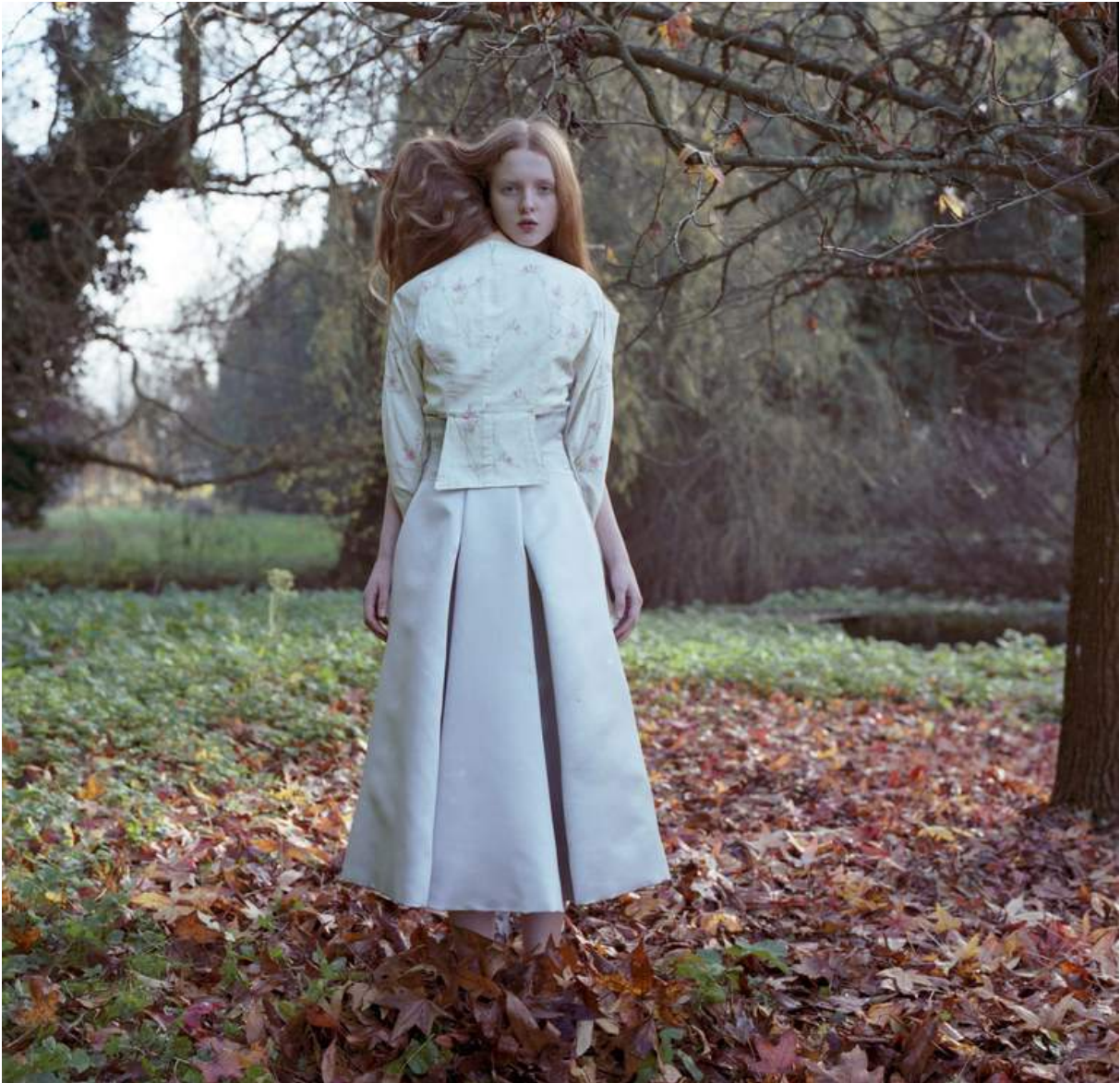
Fotografie: Hellen van Meene, Hoeveel mensen zie je hier?