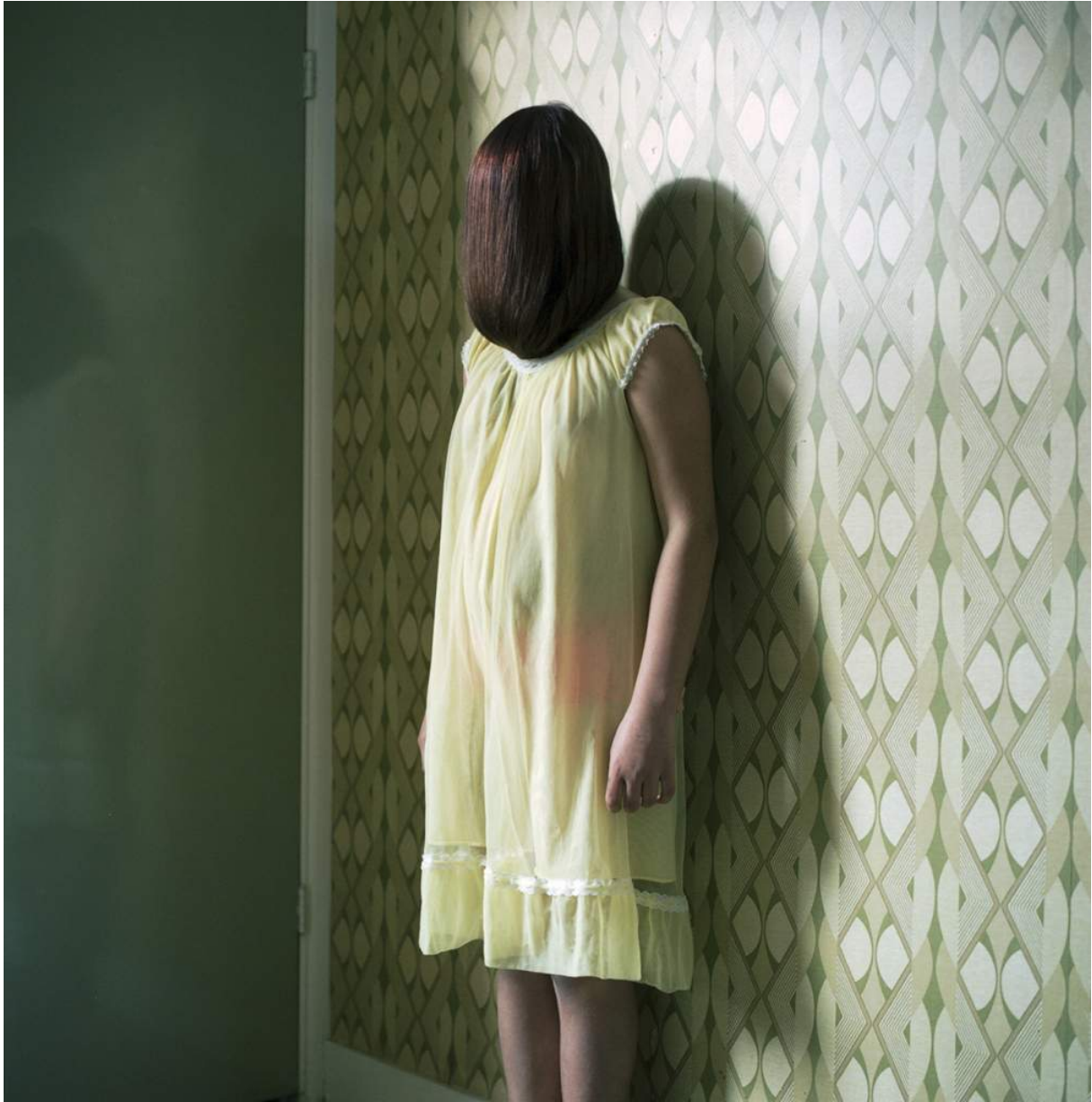
Wie heeft zich achter dat haar verstopt?