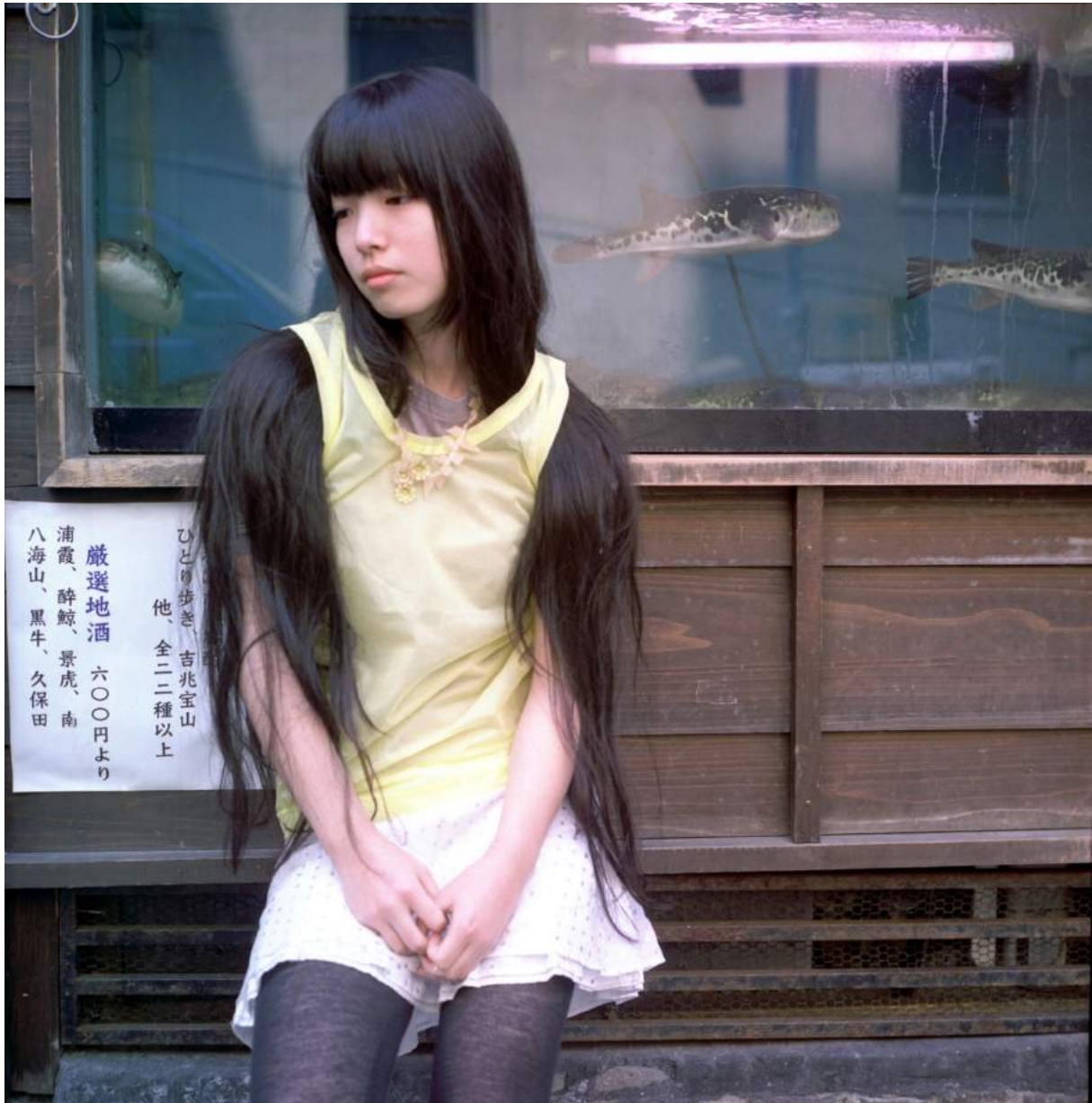
Groeit haar haar op haar armen?