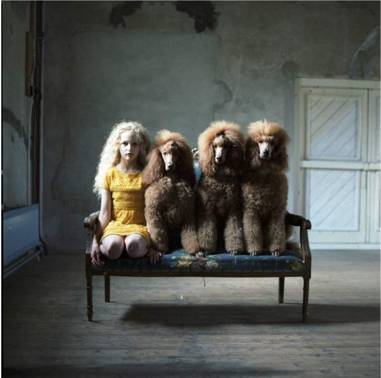
Wie heeft er het mooiste haar?