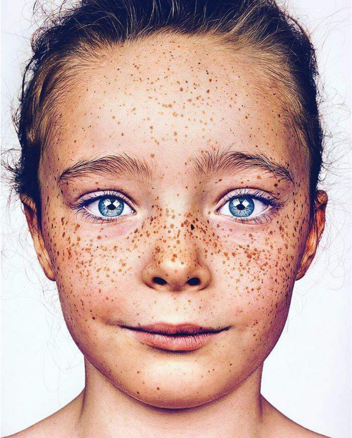
Brock Elbank The Beauty Of The Freckles