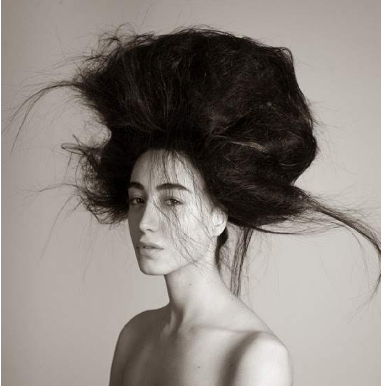
Een hoed of haar?