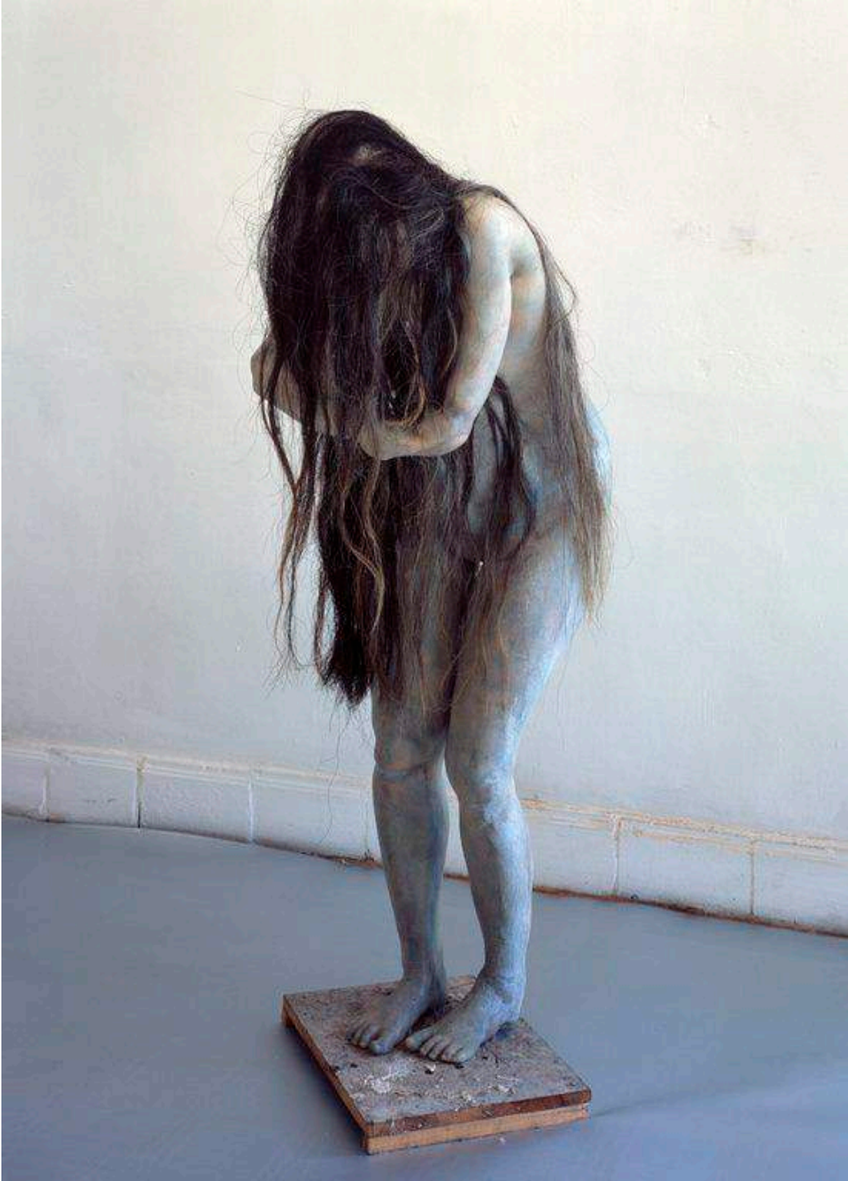
Berlinde de Bruyckere