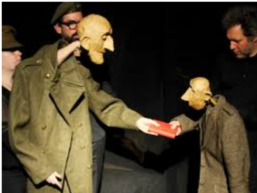
Een Oorlogshandoek voor de leerkracht