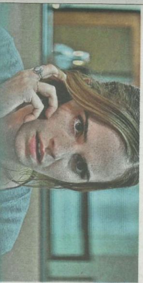
Emma Watson speelt Mae Holland.